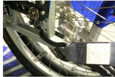
Kuvat 8 ja 9. Vapauta pyörätuolin kiinnitysremmi painamalla pinkkiä vipua ja kiinnitä remmit pyörätuolin runkoon (kaksi takana, yksi edessä) ja kiristä ratasta kääntämällä. Kiinnitä pyörätuolissa istuvan turvavyö.