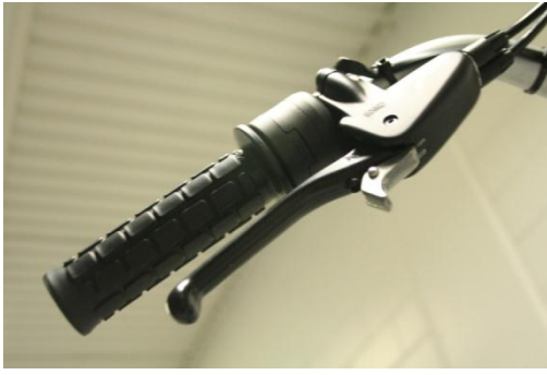
Kuva 6. Lukitse pyörän seisontajarrut painamalla käsijarru pohjaan ja lukitse jarru metallisella nokalla.